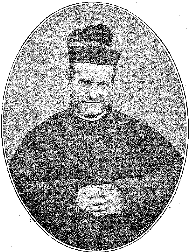
IL SAC. GIOV. BOSCO